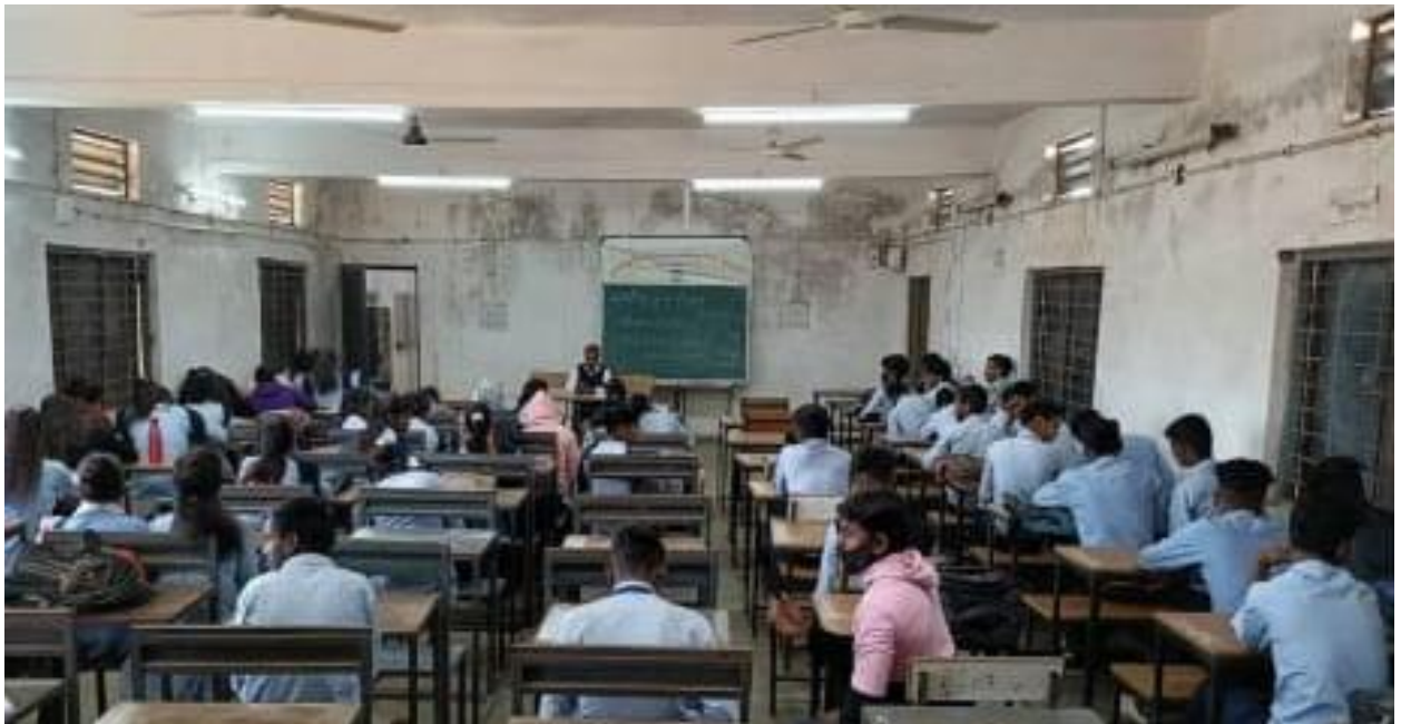
Swami Vivekanand Jayanti