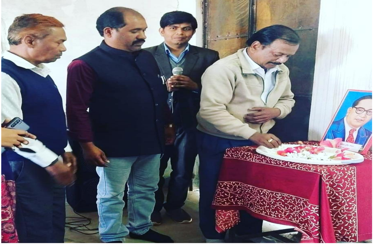
Ambedkar Jayanti or Bhim Jayanti