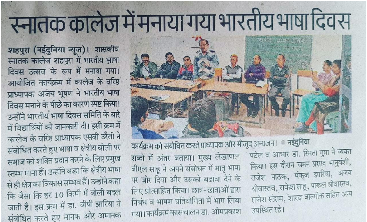
Hindi Diwas (Bhasha Divas)