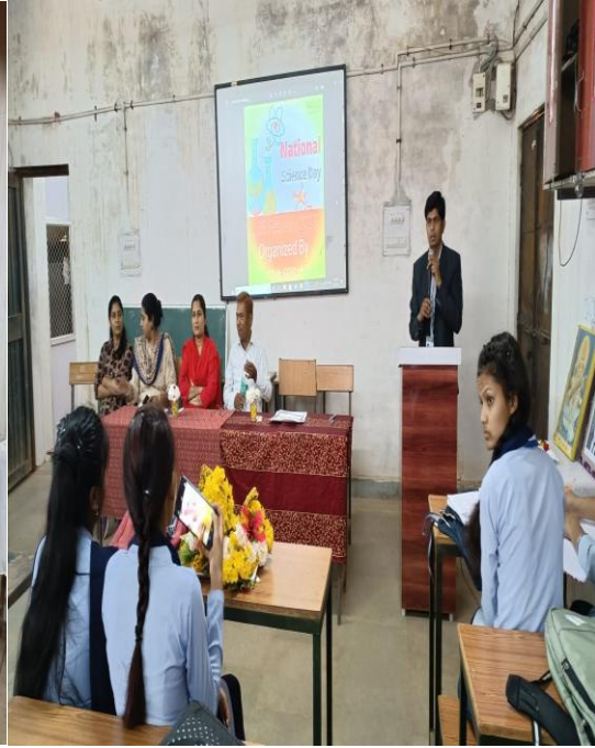
National Science Day