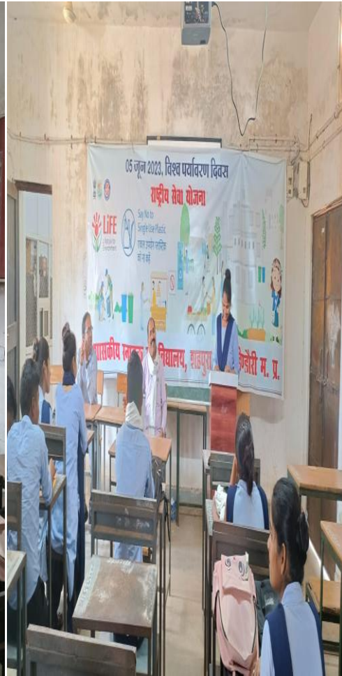
World's Environment Day